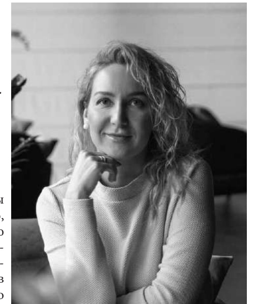
Автор проекта Юлия Байдык

В санузле опустили тройник канализации, чтобы сделать уклон для слива воды. Получилось красиво, аккуратно и удобно. На полу использовали интересную «джинсовую» плитку, которая по тактильным ощущениям похожа на ткань, и добавили немного игривости яркой плиткой на стене. Здесь много шкафов для банных принадлежностей и скрытого проточного водонагревателя.