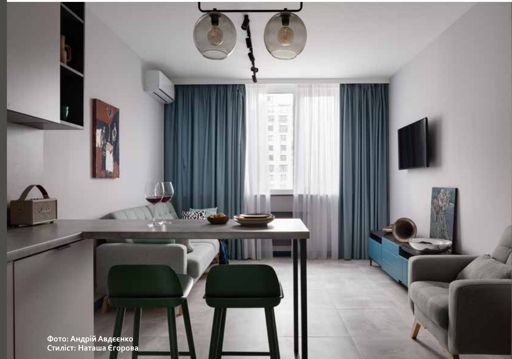
Стилiст: Наташа Єгорова