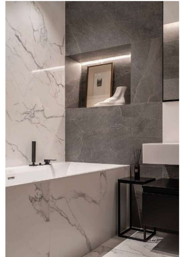
Керамическая ваза, гипсовая форма и металлические столики-консоли – Old Store

Спальня хозяев со своей гардеробной и санузлом получилась очень комфортной и спокойной, каким и должно быть настоящее место отдыха. Здесь использованы приятные на ощупь тканевые и деревянные стеновые панели, лаконичный текстиль. Именно тактильные ощущения во многом формируют чувство комфорта, поэтому авторы проекта позаботились о качественном постельном белье. Обычно в спальне остается минимум свободной площади (большую часть занимает кровать), и использовать ее лучше рационально. В результате ограничились буквально парой предметов и книг на прикроватных столиках, лаконичными художественными акцентами и аккуратными светильниками. ■