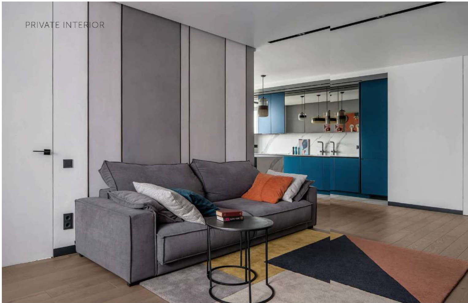
Ковер и столики – Sophie Decor