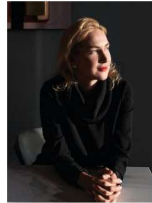
Автор проекта Юлия Байдык